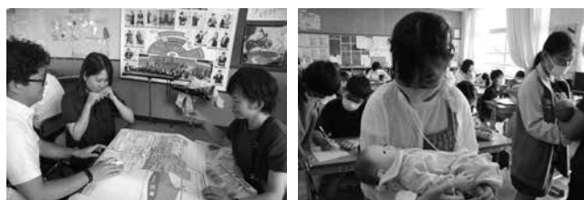
「資料6 コーチング研修」 「資料7 いのちの授業」

令和6年度は、コーチング研修（資料6）、ビジョントレーニング研修、不登校児童対応研修、I-check活用研修など、専門家を招いての職員研修を実施している。