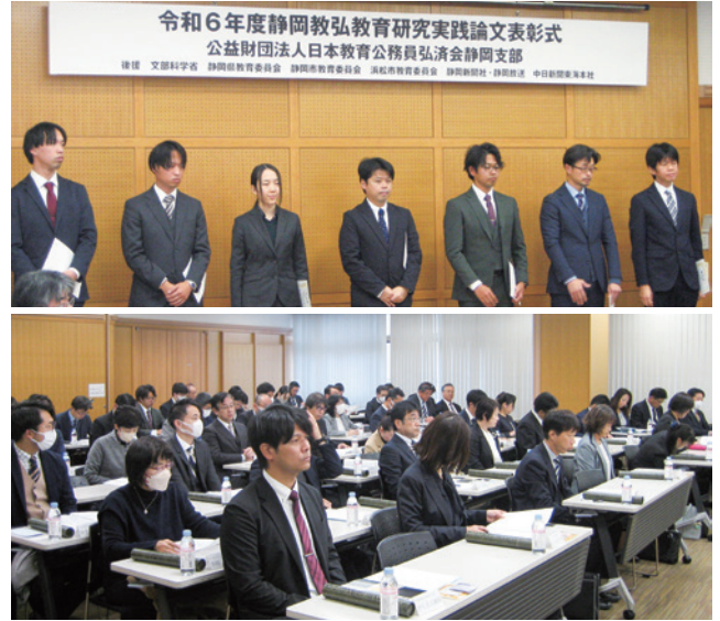
上：表彰状の贈呈 下：会場風景

「静岡教弘最優秀賞」「静岡教弘優秀賞」「静岡教弘優良賞」の論文27編を「令和6年度静岡教弘教育研究実践論文集第34集」として発行し、各園・学校には本会報とともにお送りしますのでご覧ください。