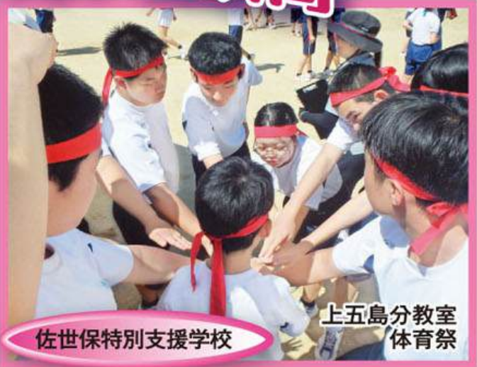
佐世保特別支援学校