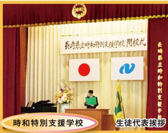
時和特別支援学校