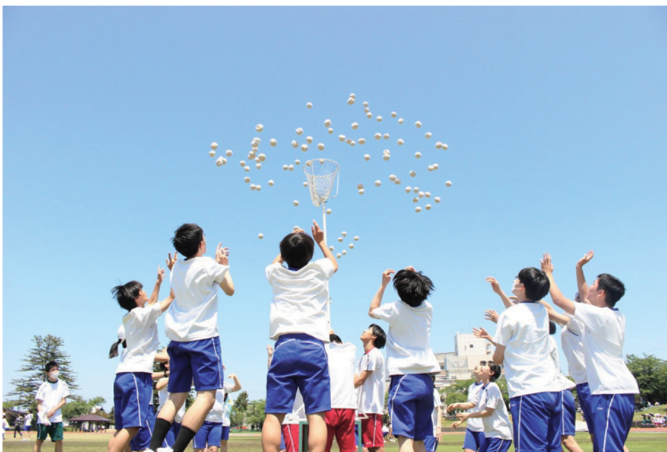
体育祭での玉入れの一瞬！見事に切り抜かれています！心1つに、カゴめがけて！ 青空と純白の玉とのコントラストが印象的！