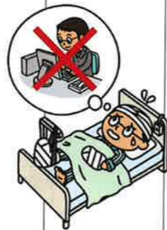
厚生労働省「令和2年(2020)患者調査の概況」より抜粋