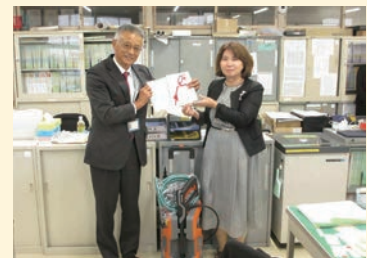
「目録贈呈式」津島市立高台寺小学校