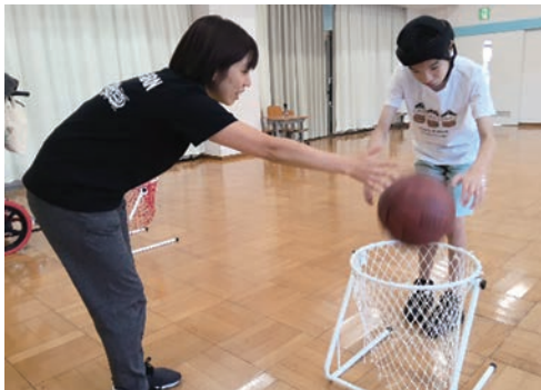
「バスケットボール！ゴールへポン」