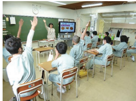
「おいしく食べる献立を考えよう」

学校給食を活用した教科等横断的な食育 ～栽培活動での野菜を活用したSDGsの取組～