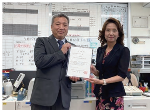
名古屋市立児玉小学校 委嘱状贈呈式